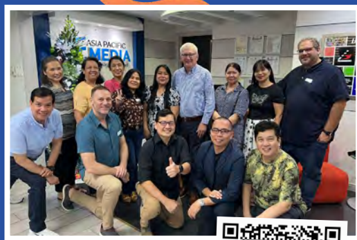
Clip 36 Jahre AP Media Feier