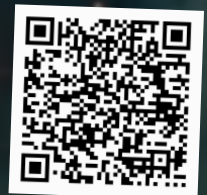
Save the date Video

Im Mai nächsten Jahres steht ein weiteres Highlight an: Ich darf eine große Medienkonferenz hier auf den Philippinen leiten und vorbereiten! Wir erwarten rund 700-1000 Medienmitarbeiter, die zusammenkommen, um inspiriert, ermutigt und für ihren Dienst ausgerüstet zu werden. Es ist eine enorme Verantwortung aber es macht mir auch viel Spaß diese Konferenz zu planen und zu gestalten. Bitte unterstützt uns im Gebet!