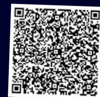
Youtube Videos Likha